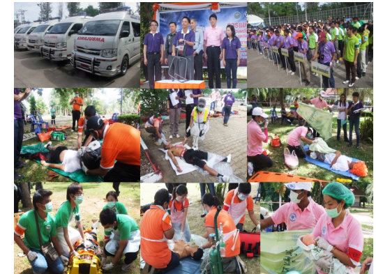
ภาพกิจกรรมโครงการ ภายใต้การประสานงานของ สถาบันการแพทย์ฉุกเฉินแห่งชาติ

DMAT DMAT DMAT DMAT DMAT DMAT DMAT DMAT DMAT DMAT