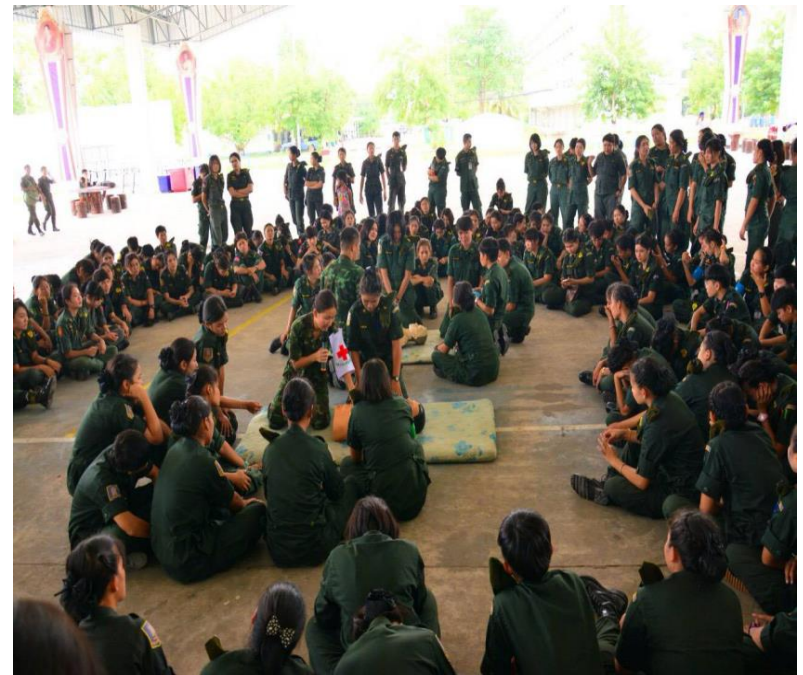
มทบ.23 นำแนวคิดไปต่อยอดอบรมต่อ