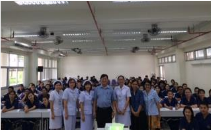
Practicing at pre-hospital