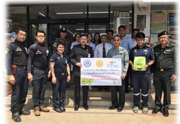
สาขา อ.เวียงเชียงรุ้ง จ.เชียงราย