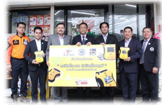
สาขาตลาดสุนทรโกษา คลองเตย กรุงเทพฯ