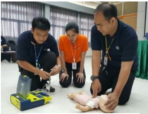
อบรมบุคลากร (ครู ก.)