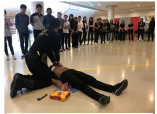
หลักสูตรการอบรมพนักงาน