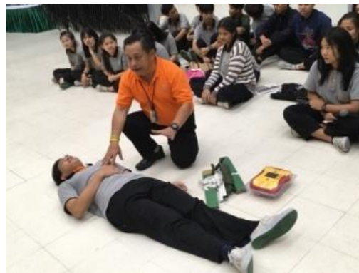
หลักสูตรของวิทยาลัยฯ